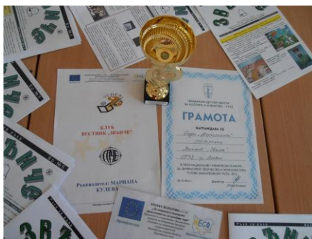
Вестник „Звънче“ - поощрителна награда