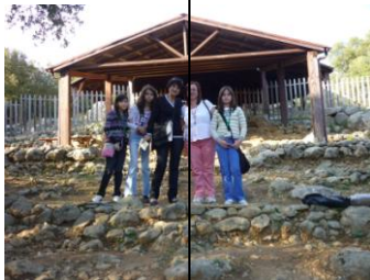
Гробницата на Одисей