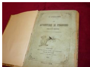
„Пинокио“ – първо издание