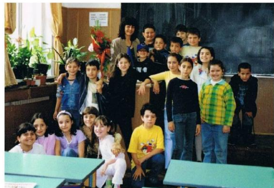
Репортерите на вестник "Звънче", май, 2003г.