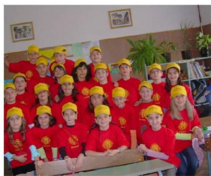
Репортерите на вестник "Звънче", март, 2008г.