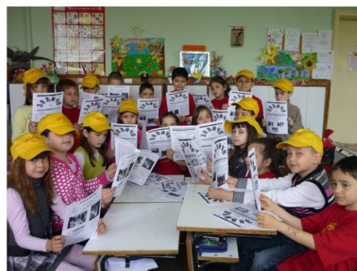
Репортерите на вестник "Звънче", март, 2010г.