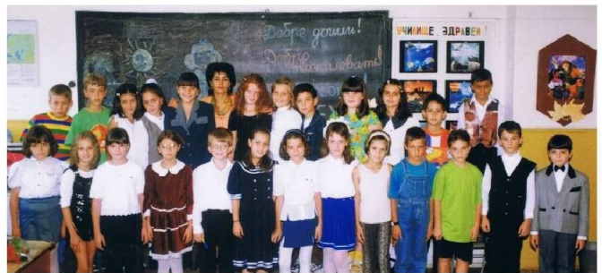
Репортерите на вестник "Звънче", септември, 2000г.