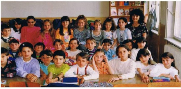
Репортерите на вестник "Звънче", декември, 1996г.

Бяха ученици в 4 клас – първо, вестничето беше във формата на стенвестник, и във връзка с обявения конкурс на движението „Рицари на познанието”, решихме да го направим истински – но не знаехме как. Безценна и възрожденска беше помощта на един татко - Христо Андровски, разбиращ от компютри. И се започна: