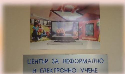
ЦЕНТЪР ЗА НЕФОРМАЛНО И ЕЛЕКТРОННО УЧЕНЕ